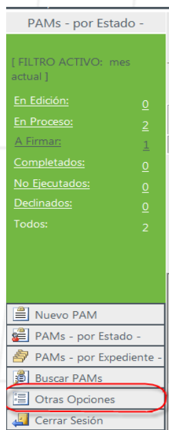
Figura 7.1 Otras Opciones

Una vez dentro del portal de bSigned localizar y acceder a la liga Otras Opciones (Figura 7.1) localizada en el menú de la parte izquierda inferior.